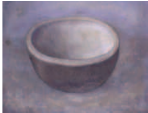
Jan van Herwijnen, Houten kom, 1935, olieverf

Zijn stijl was groots en indringend, in overeenstemming met zijn indrukwekkende uiterlijk. Vanwege zijn forse gestalte werd hij wel vergeleken met een leeuw of een stier, een beeld dat versterkt werd door zijn (al vroeg grijze) haren die als leeuwenmanen zijn gezicht omsloten.