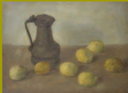
Jan van Herwijnen, Stilleven, kan met citroenen, 1941, olieverf