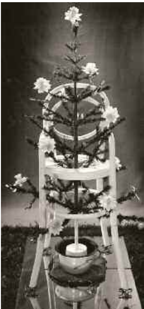
Chr. J. van Geel, Jeunesse d'un Narcisse , 1939.

In 1938 was er in de Amsterdamse galerie Robert een zogenaamde exporttentoonstelling te zien van de Parijse surrealist. Van Geel raakte diep getroffen door de objecten die daar te zien waren, zoals een met bont beklede kop, een schotel en een lepel van Méret Oppenheim en 2 vrouwenbenen in de hoorn van een grammofoon. Voorts werden er 'decalcomanieën' geëxposeerd, vlekken die ontstaan door papier met natte verf op ander papier te drukken. Een