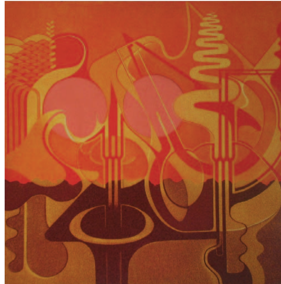
Rik Fernhout Zonder titel, 2004 acryl op linnen en aluminium 90 x 90 cm

Een tentoonstelling is namelijk niet een aantal bij elkaar geraapte kunstwerken, maar toont ook een visie en een keuze. De keuze zegt iets over de samensteller en het museum. Ik heb gekozen voor kunstenaars en ontwerpers die, ongeacht hun leeftijd, met beide benen in de hedendaagse kunst en cultuur staan. Het zijn kunstenaars die invloed hebben op de ontwikkelingen in de hedendaagse kunst, of waarvan ik vind dat ze die moeten hebben, of waarvan ik denk dat ze het talent hebben om die invloed te krijgen. Er zijn kunstenaars bij die door omstandigheden nog maar heel weinig hebben laten zien, maar die wel werk maken dat de toets der kritiek kan doorstaan. Het zijn stuk voor stuk mensen die echt met iets bezig zijn. Mensen voor wie het maken van kunst een noodzaak en geen hobby is. Het zijn talenten, waarvan sommigen in volle bloei staan, terwijl anderen zich nog maar net hebben ontplooid. De oudste 'jonge kunstenaar' is 70 jaar, de jongste 28. Een ander opvallend fenomeen in die leeftijdsverdeling ontdekte ik pas recentelijk. Bij de selectie heb ik niet gekeken naar leeftijd of