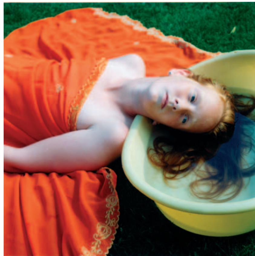
Hellen van Meene Untitled 1999 c-print 39 x 39 cm

Het is voor het museum onmisbaar dat bedrijven en particulieren het museum (blijven) ondersteunen. De schenking van € 20.000,- van een particulier was een zeer bijzondere en welkome bijdrage. Ook de ondersteuning van fondsen, bedrijven, gemeente en provincie bij de totstandkoming van de verschillende tentoonstellingen is groot geweest.