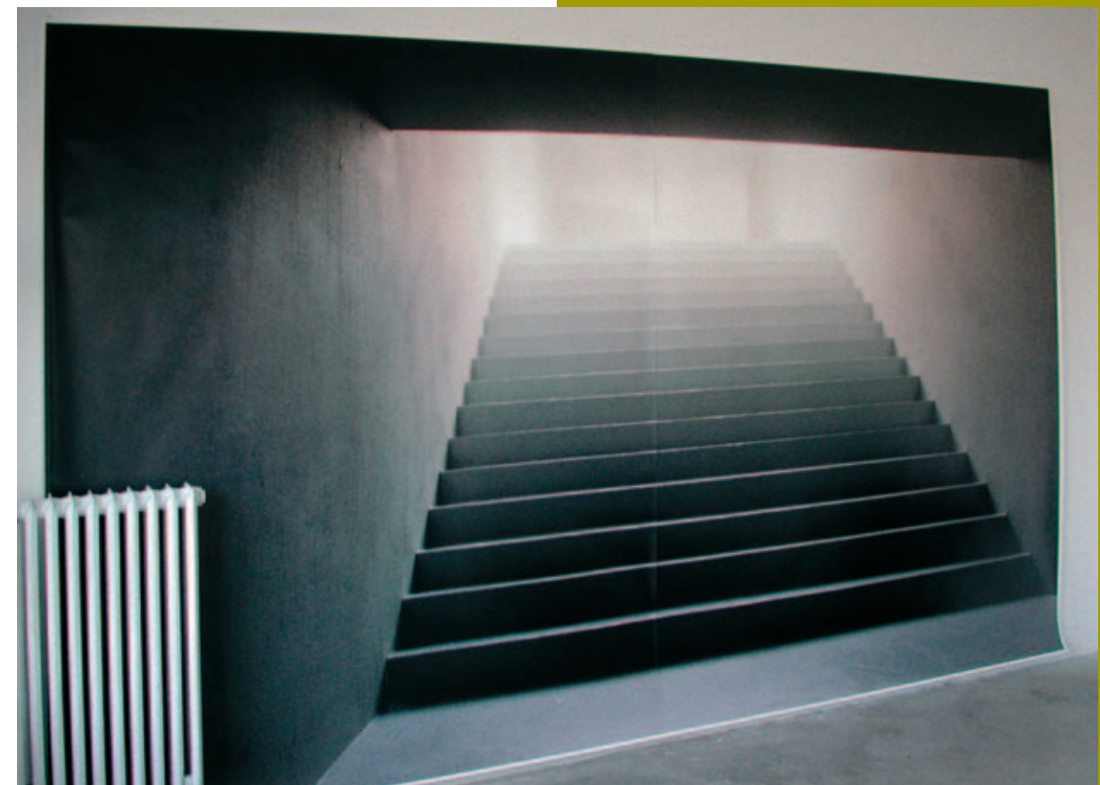
Michiel Kluiters Stairs 4 2003 inkjetprint op papier 270 x 450 cm