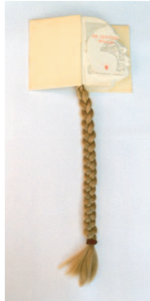
Sonja Kruit De Zevende Maagd anno 2001 sculptuur 71 cm x 15 cm x 4 cm papier en kunsthaar

Het monumentale portret is te zien in de tentoonstelling 'Bronnen' en zal eveneens worden geëxposeerd tijdens de tentoonstelling over 'De Nieuwe Kring' die gepland staat voor 2006.