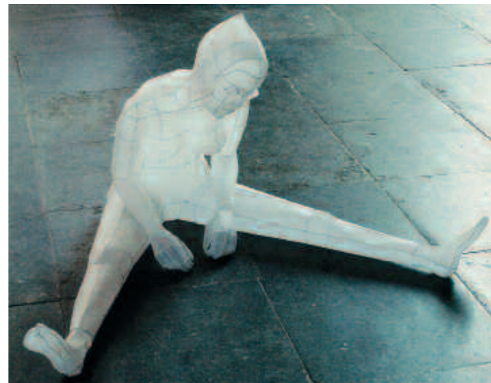
Esther Bruggink, Enantiodromia , 2002

De werken zijn beeldend met elkaar in gesprek en ik hoop dat u straks in het museum ook het gesprek met ze aangaat.