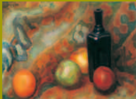
Leo Gestel, Vruchten en Blauwe Flesch, 1917-18, uit de collectie Calpe