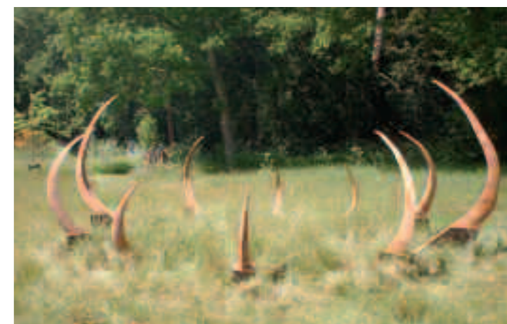
Ingerid Opstelten, Ribben , 1995, na restauratie in 2006

Hierna kreeg het een nieuwe verfbeurt. Oorspronkelijk had ik alleen de zijanten van de sokkels gebeist en de rest van het hout alleen met witte pigment en blanke